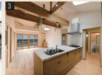
梁現しの開放的なLDK