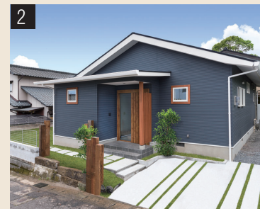
自然と調和するカラーに一新された外観