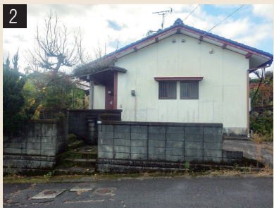
圧迫感を感じる古びた外観