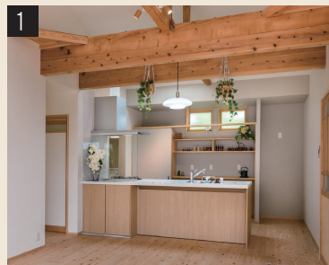
ペニンシュラ型の対面キッチンに変更