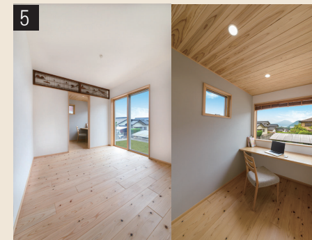
玄関向きを変更し、南側に洋室と書斎を増築