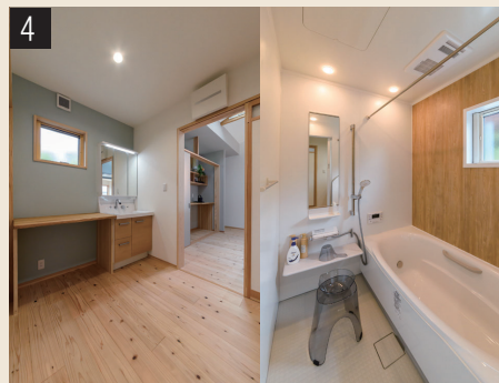
配置も仕様も一新された水まわり