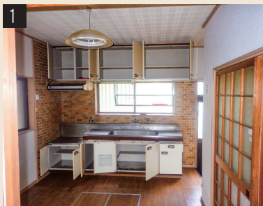
壁付型キッチンの中所