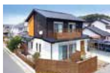
第27回 住まいるリフォームコンクール 県知事賞受賞