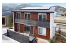
かごしま木造住宅コンテスト2017 鹿児島県木造住宅推進協議会会長賞