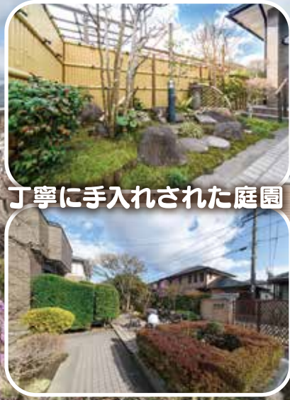
丁寧に手入れされた庭園