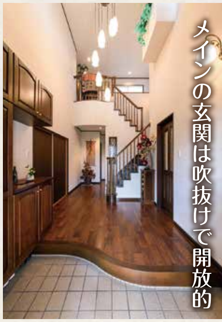
メインの玄関は吹抜けで開放的