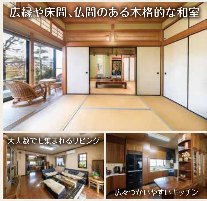
広縁や床間、仏間のある本格的な和室