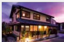
建築研究所すまいづくり住宅部門 地域住宅奨励賞受賞