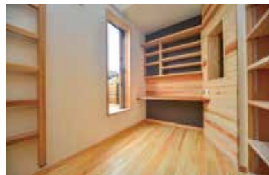
書棚に囲まれ、集中して作業できる空間