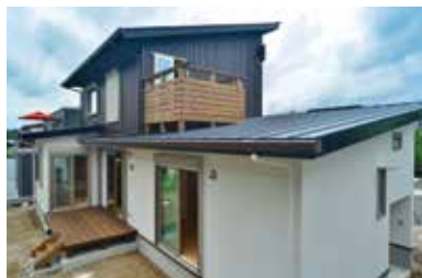
2階書斎部分にはご主人専用のバルコニー