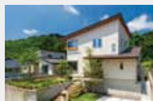
エネルギー自給自足の環境に優しい家 ゼロ・エネルギー住宅