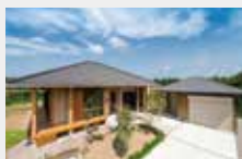
鹿児島木造住宅コンテスト2015 県知事賞受賞