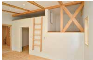
1階主寝室にはロフトと大容量ストレージ